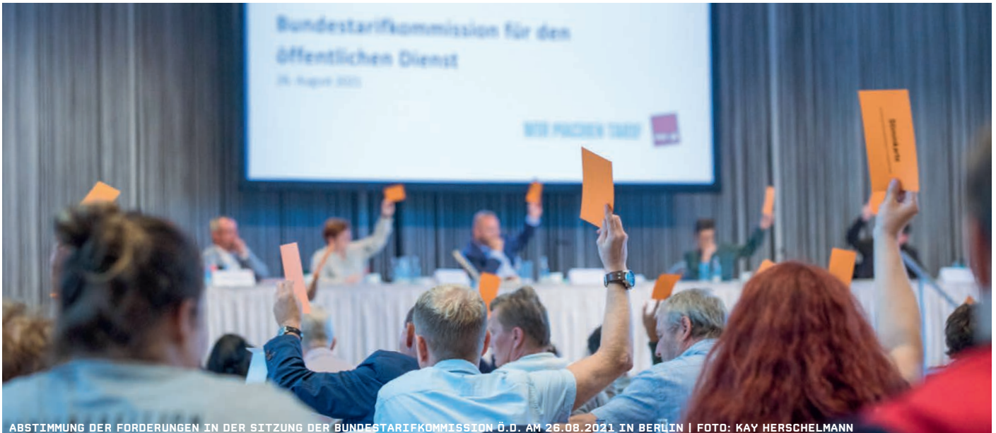
ABSTIMMUNG DER FORDERUNGEN IN DER SITZUNG DER BUNDESTARIFKOMMISSION Ö.D. AM 26.08.2021 IN BERLIN

Wir halten den Laden am Laufen. Handeln. Für Morgen!